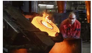
Metallerzeugung und -verarbeitung