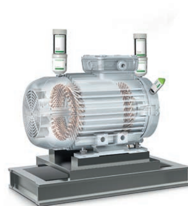
Surveillance conditionnelle des moteurs électriques