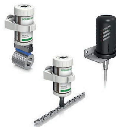
Divers accessoires disponibles (au choix)