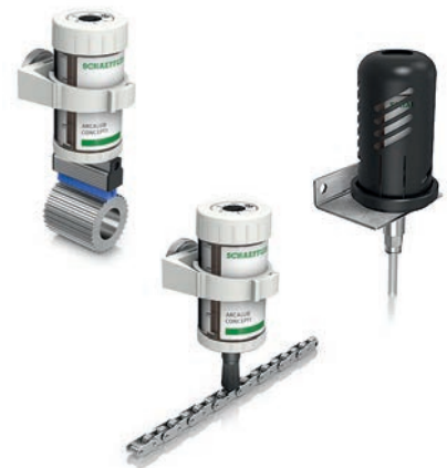
Vierfältiges Zubehör verfügbar (Auswahl)