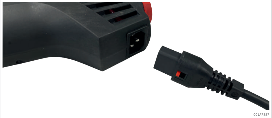
4 Conectar o cabo de alimentação