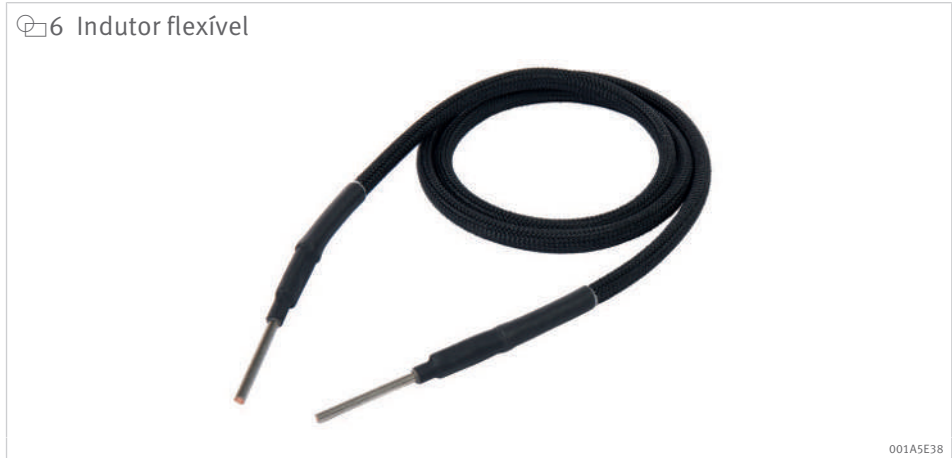
6 Indutor flexível