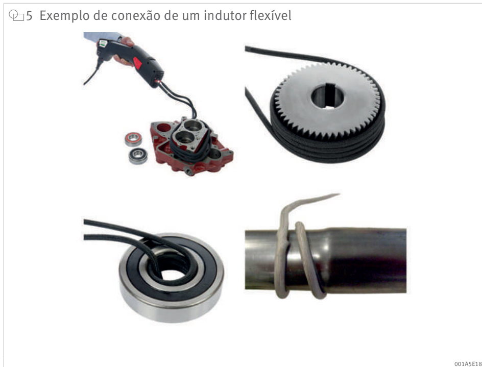
5 Exemplo de conexão de um indutor flexível