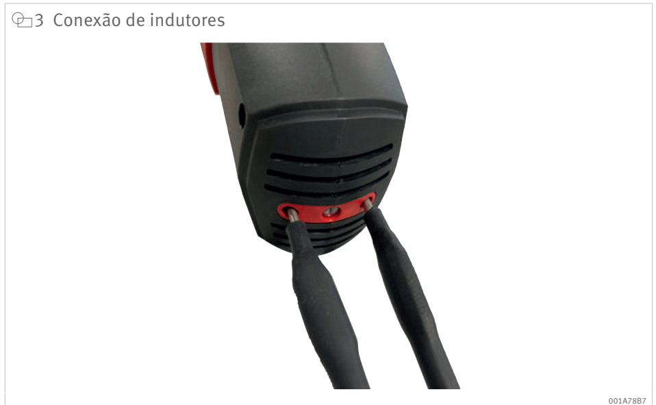
3 Conexão de indutores